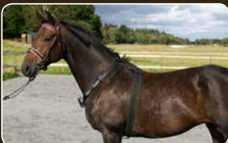
HorseAlarm est solidement attaché à votre cheval.