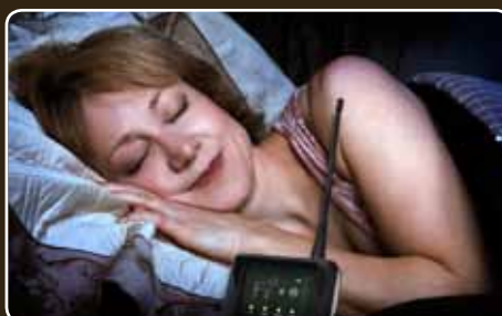
Surveillez confortablement depuis votre maison.