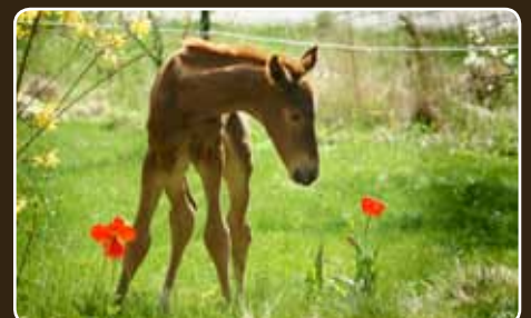
Pour la surveillance de votre cheval et une mise bas sûre et réussie de votre jument.